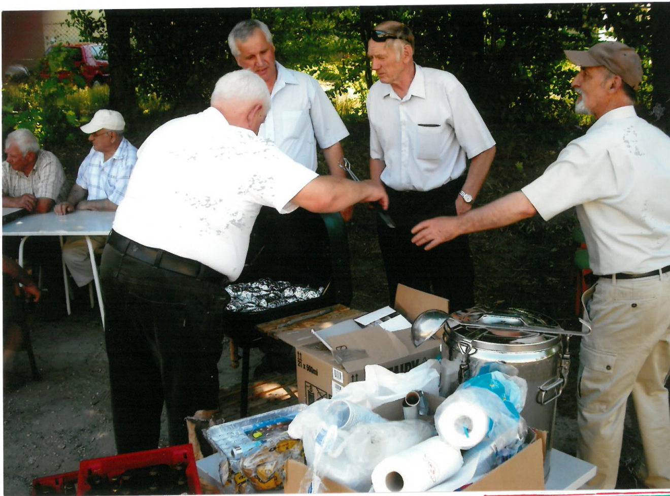
Сотрудники Лангел в складские обслуги грила адмрава. Франс. Песлак, Якубевык Ст. Сецытовски Л. Копавя Т.